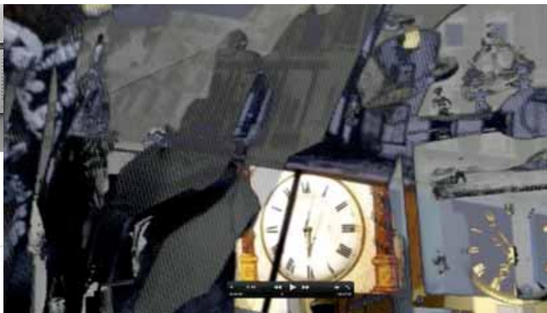
„Mathildes Reise“ ein Film von Carmen Oberst und Wittwulf Y Malik